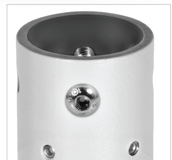
Sicherungsbolzen und Madenschrauben sichern den Adapter an Rohren und der Deckenhalterung