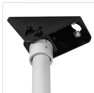
Ideal für die Verwendung mit System 2-Halterungen wie BT7808 , BT7012 , BT7017 & BT7825