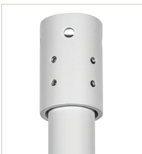
4mm robuster Stahl trägt erhebliche Lasten mit minimaler Bewegung der montierten Rohre